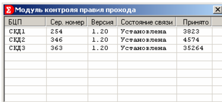
Рис. 1 Форма модуля проверки правил прохода

В первом поле списка указывается имя БЦП, которое задается в Рубеж Конфигуратор. Во второй колонке – серийный номер БЦП. Далее – версия программы БЦП. Состояние связи с БЦП или по локальной сети. Последняя колонка – количество принятых сообщений от БЦП о проходах пользователей.